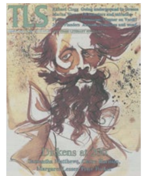
The Times Literary Supplement, Friday, February 10, 2012