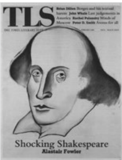
上图: The Times Literary Supplement, Friday, November 21, 1980