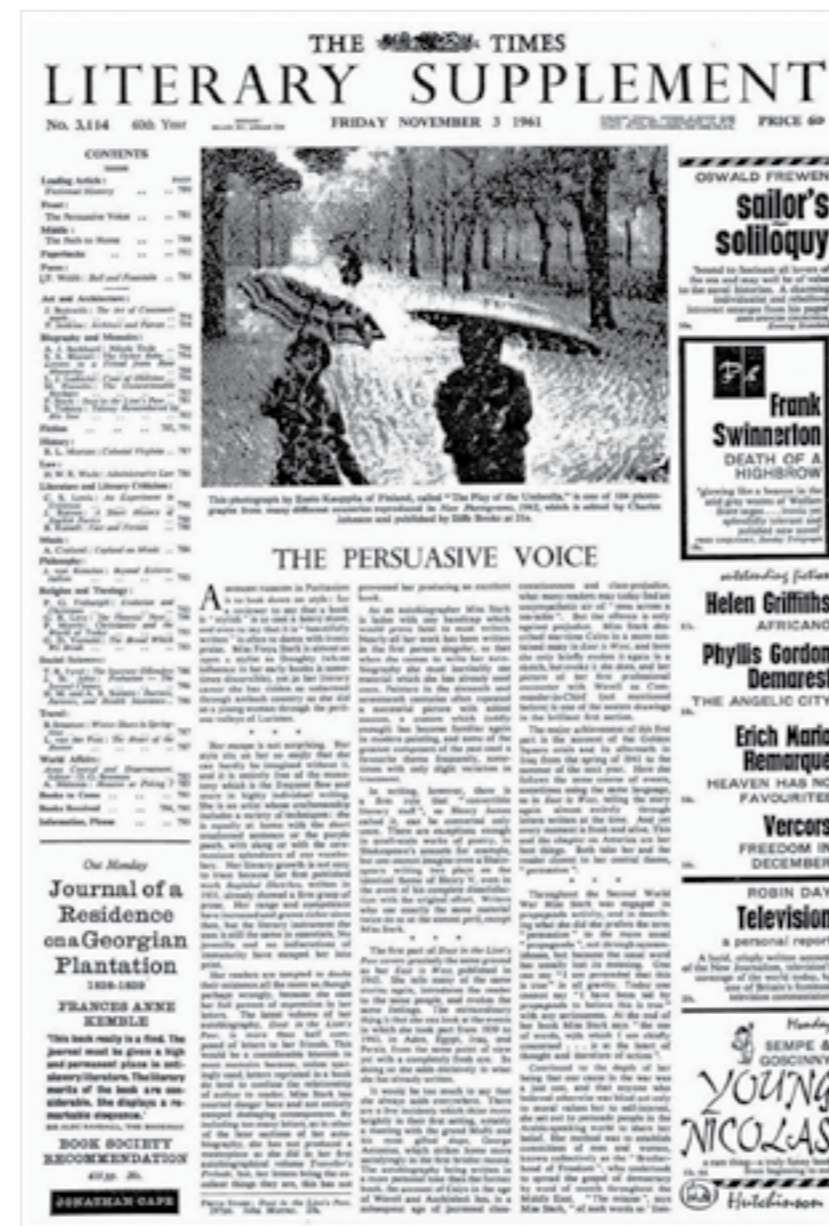
The Times Literary Supplement, Friday, November 03, 1961