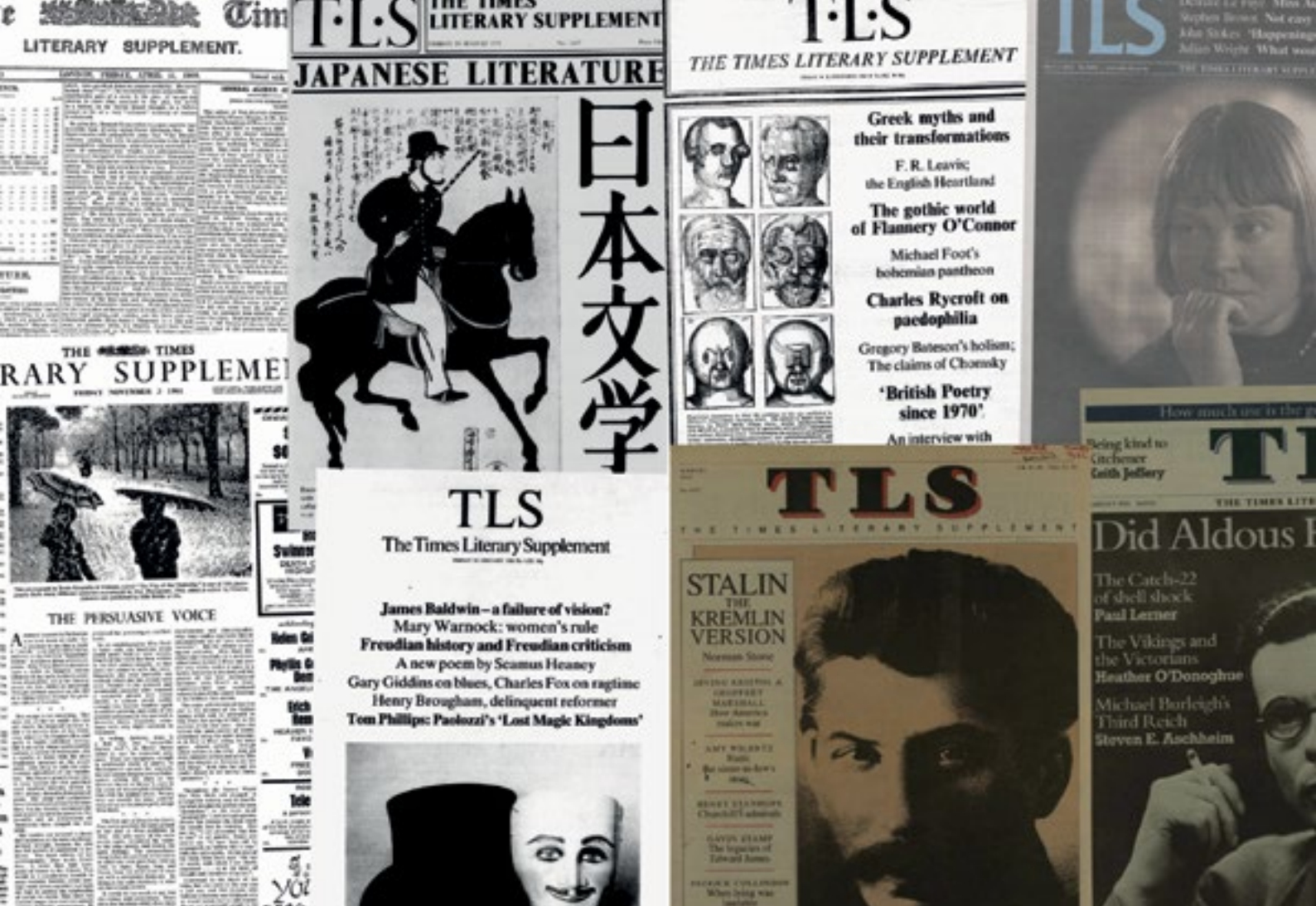
Various sources. Primary Source Media. Times Literary Supplement Historical Archive 1902-2012.