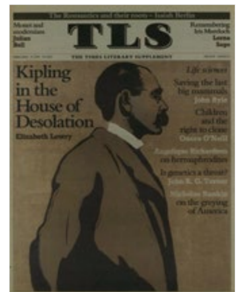
The Times Literary Supplement, Friday, February 19, 1999