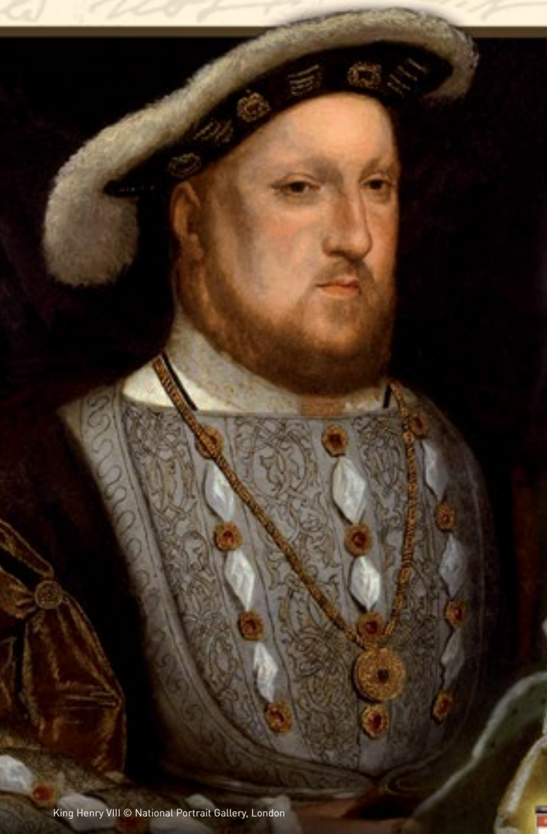
King Henry VIII