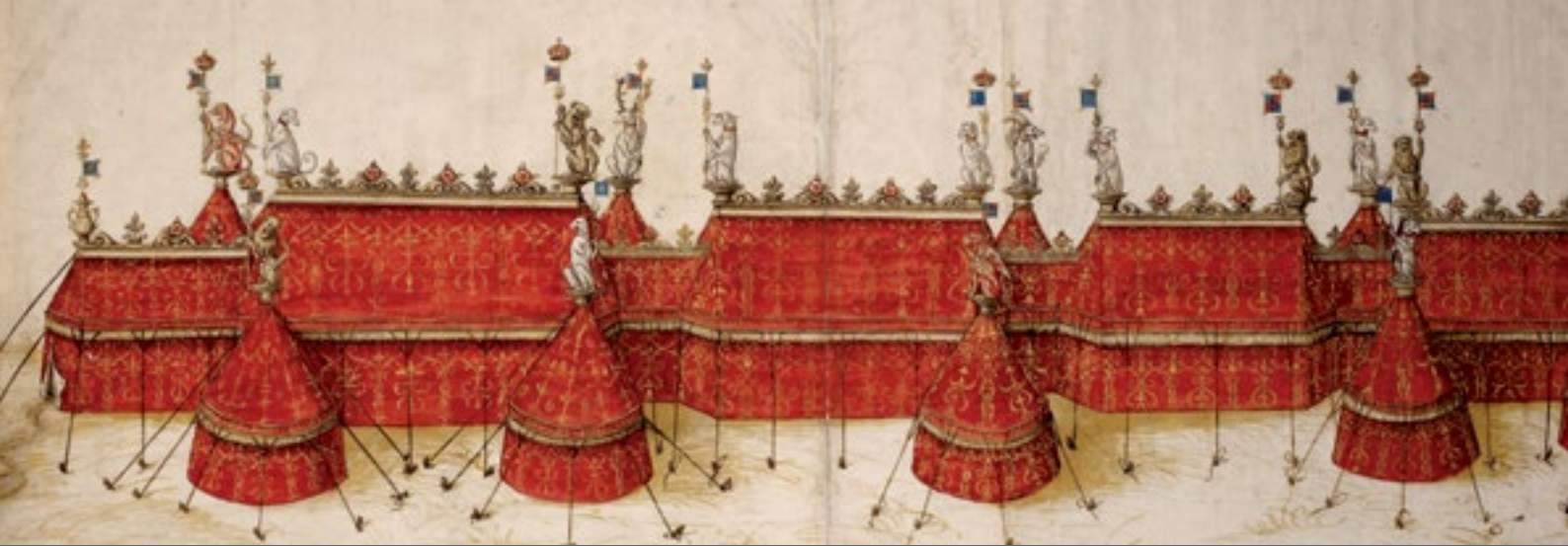
Field of the Cloth of Gold in 1520

“英国政府档案在线”对理解都铎王朝和斯图亚特王朝时期的政治、社会、文化、宗教和经济状况至关重要，提供了贯穿全部国内和外交事务的原始历史手稿。因此“英国政府档案在线”是任何从事文艺复兴、宗教改革、王政复辟和启蒙时期学习和研究的学生和研究者的核心资源。