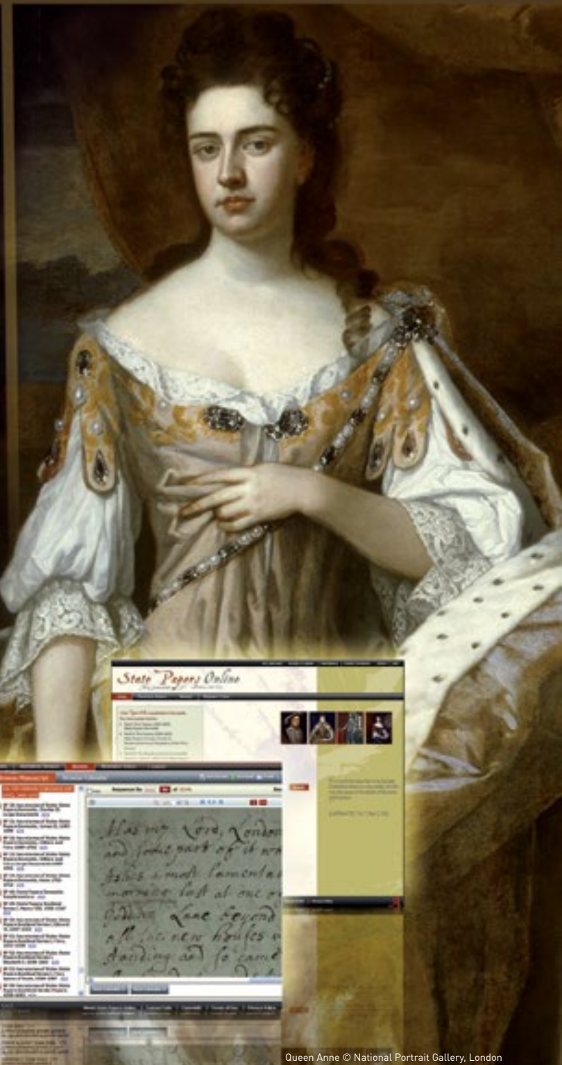
Queen Anne