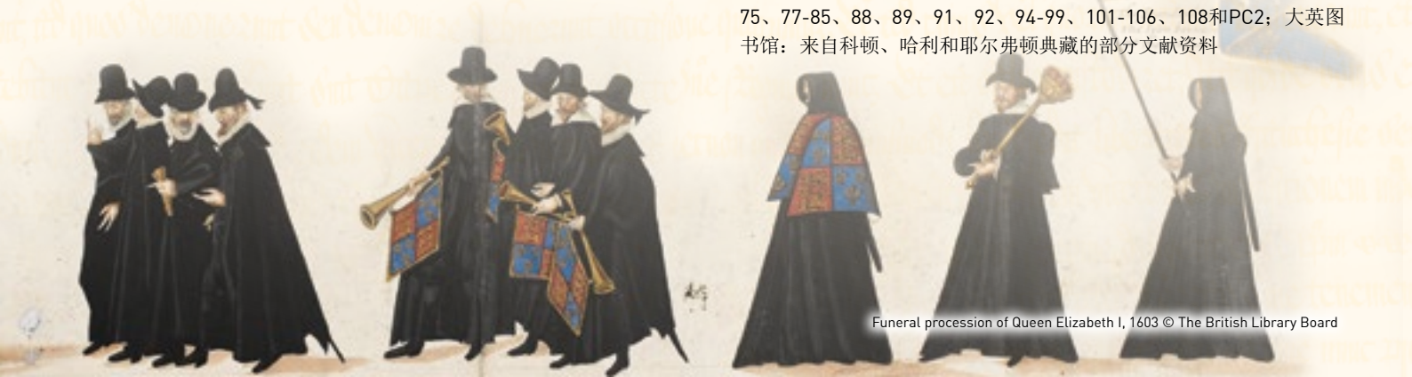
Funeral procession of Queen Elizabeth I, 1603

伦敦英国国家档案馆：SP 46、49、50-53、59-63、65、66、68-71、75、77-85、88、89、91、92、94-99、101-106、108和PC2；大英图书馆：来自科顿、哈利和耶尔弗顿典藏的部分文献资料