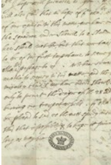
Mary II congratulates William III on his victory against her father, James II, at the Battle of Boyne, July 7 1690