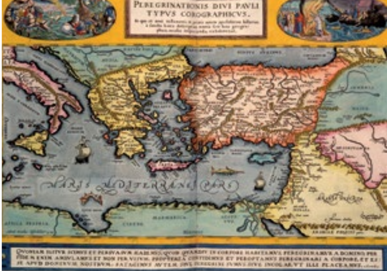
Map of the Mediterranean, 1595