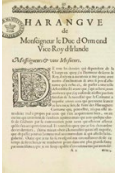
Harangue of His Grace the Duke of Ormond, Viceroy of Ireland, 1663